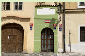
Nejmenší dům v Praze

Opět je tu další článek z prostředí hlavního města Prahy. Tentokrát se zaměříme na kuriozity a zajímavosti o kterých jste v Praze určitě nevěděli: