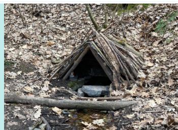
Pod Moravcovým lesíkem

2.) Studánka Pod Moravcovým lesíkem , nebo V Modřanské rokli - malá studánka s čistou vodou, nově má teď dřevěný přístřešek. GPS: 50.0020908N, 14.4369528E