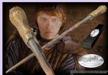
Ron: Dřevo: Jasan. Jádرو: Žíně jednorožce. Velikost: 12"/30,48 cm.

1. Mozkomor se živí šťastnými pocity a vzpomínkami, které vysává z lidí. Když mozkomor někomu dá svůj polibek, zabije ho.