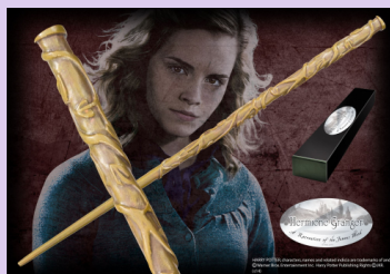
Hermiona: Dřevo: Vinná réva. Jádرو: Blána z dračího srdce. Velikost: 10¾" / 27,31 cm.