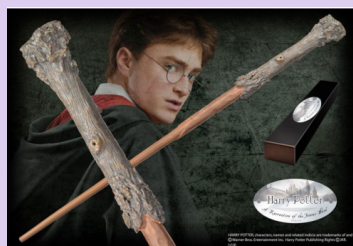
Harry: Dřevo: Cesmínové. Jádرو: Pero fénixe. Velikost: 11" / 27,94 cm.