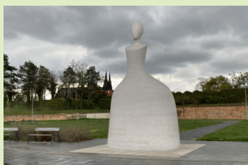
Socha Marie Terezie v parku na Prašném mostě a Kbelskou třídou

4.) Skalní útvary Cihelna v Hloubětíně - nad Hloubětínem se vypínají skalní útvary z pískovce a slepence bez půdního pokryvu, zvané Cihelna. Neobvyklou podívanou najdete nad Kolbenovou